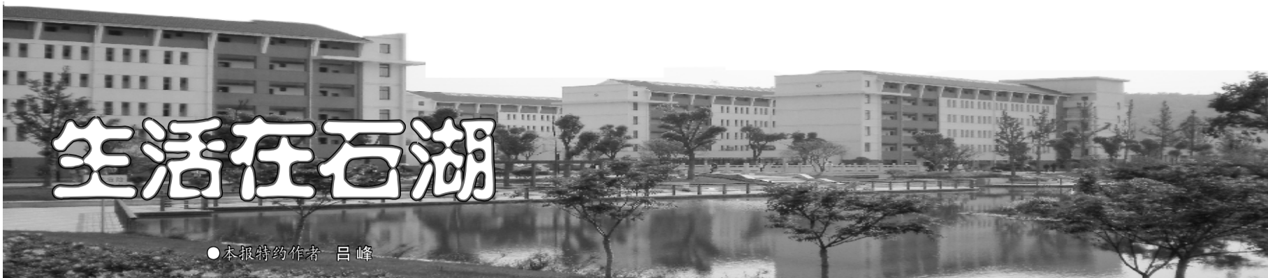
●本报特约作者 吕峰