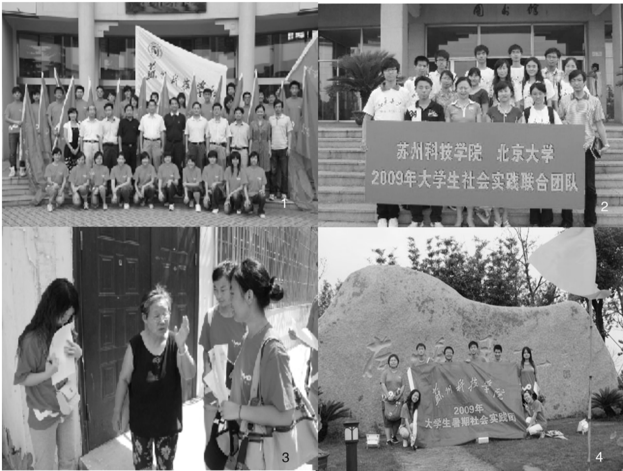
(图 1:暑期实践出征仪式 图 2:我校与北京大学联合团队 图 3:我校学子深入社区 图 4:景区考察团队)